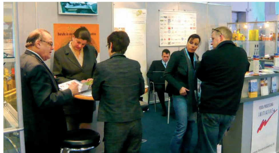
Fachgespräche am FPI-Stand.