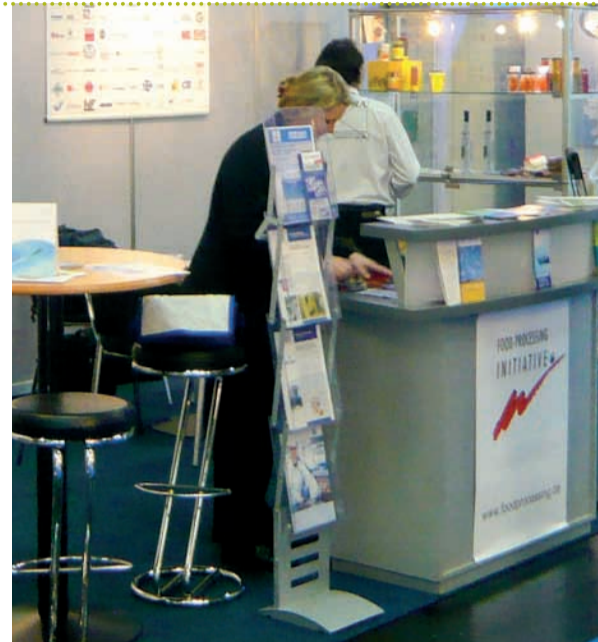
Der FPI-Stand auf der Anuga FoodTec 2009.