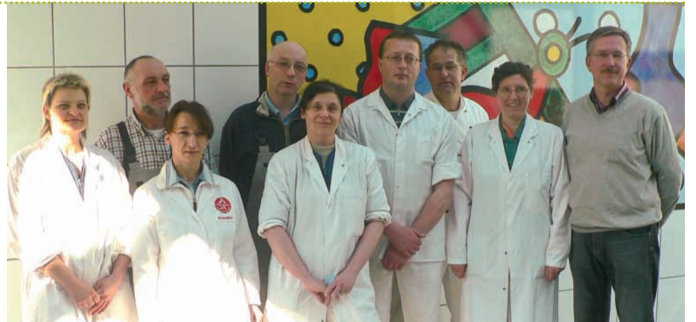
Der Betriebsrat der Wiltmann GmbH &amp; Co. KG.