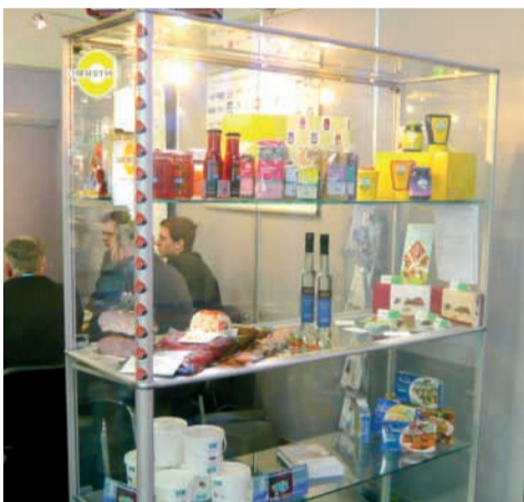
Exponate auf der Anuga FoodTec 2009.

Die Exponate stießen beim Fachpublikum auf reges Interesse. »Wir haben Anfragen zu unseren neuen und erstmals öffent-