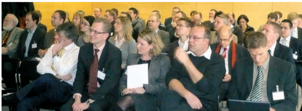
Teilnehmer des 1. FoodSpot Workshop

Der zweite FoodSpot Workshop »Meet food sensory innovations @ Food Valley« findet am 27. Mai 2009 in den Niederlanden statt. Das Programm gewährt Einblicke in neue Technologien und Entwicklungen der sensorischen Aspekte im Lebensmittelbereich sowie einen interaktiven Programmteil mit Demonstrationen, die das Gehörte sehen, fühlen, riechen und schmecken lassen.